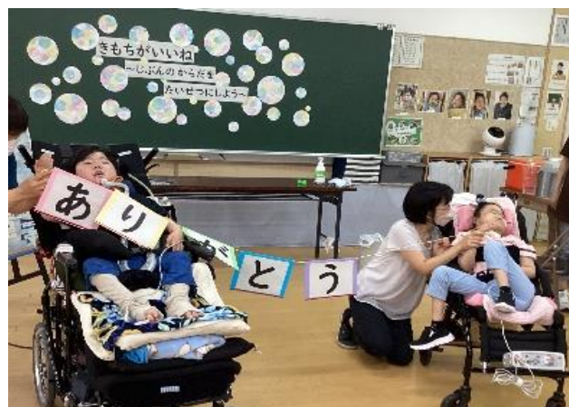
感謝の気持ちを協力して伝えました。