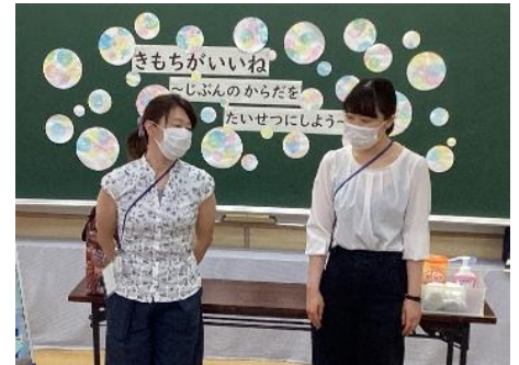
養護教諭からお話がありました。

7月20日（木）に行われた全体スクーリングでは、子どもたちが保護者と一緒に手の汚れをチェッカーで確認し、指先や指と指の間の汚れに注意して手を洗いました。手洗いの後、養護教諭から「手を洗うことや体を清潔にすることの大切さと必要性」について話がありました。子どもたちは、手を洗ったり、足湯をしたりすると、眉間の力が抜けて笑顔になりました。一人一人が「気持ちがいい。」と感ずることができたようです。