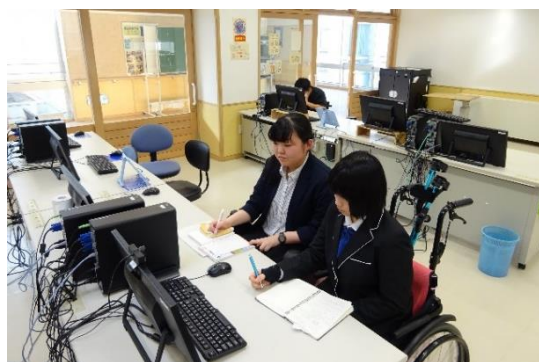
リモート交流の様子

五月十四日の放課後に日本大学東北高等学校の生徒会と本校の生徒会でリモート交流を行いました。本校からは会長、副会長及び書記の三名が参加しました。今回は、事前にテーマを四つ決めて話し合いをしました。