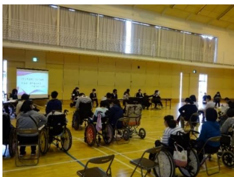
各委員会による活動計画案の報告（左）と会計予算案の提案（右）