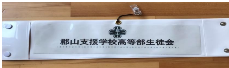
実際に腕章をつけている様子（左）