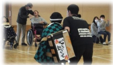
炭治郎を模したクラス紹介

二学年、三学年、一年の順番でクラス紹介を行いました。二学年は、クラス紹介で芸を披露して紹介するクラスがありました。三学年は、大ヒットしたアニメ「鬼滅の刃」の竈門炭治郎の格好をしながら紹介