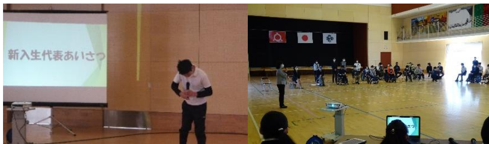
新入生代表あいさつの様子（左）と校長先生あいさつの様子（右）

「鬼滅の刃」の竈門炭治郎の格好をしながら紹介 「鬼滅の刃」の竈門炭治郎の格好をしながら紹介