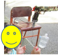
VOCA (Voice Output Communication Aids)

自分でスイッチを押すことで、植物に水をあげる、ラジコンが動く、水鉄砲が飛ぶ、音声であいさつをするなど、いろいろなことができるようになります。