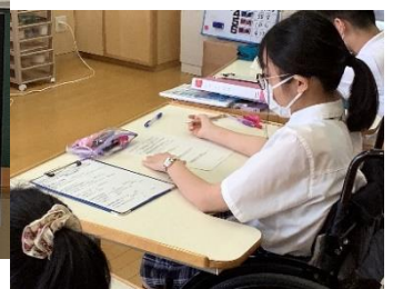
オンライン授業の様子