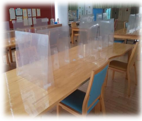
ランチルームに飛沫防止用のつい立が設置されました。