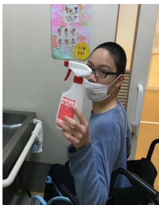
消毒液の補充も忘れずに！