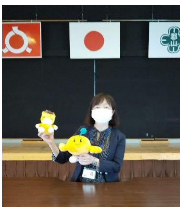
『キビタン』は何県のマスコットでしょう？

高等部の始業式では、「キビタン」のぬいぐるみを取り上げ、福島県とのつながりに触れてみました。「身近にある物を意識すると様々な気づきがあること」「発見や気づきは学びとなり生活を豊かにすること」を伝えました。